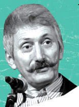
Михайло Кальницький києвознавець, історик, літератор, журналіст